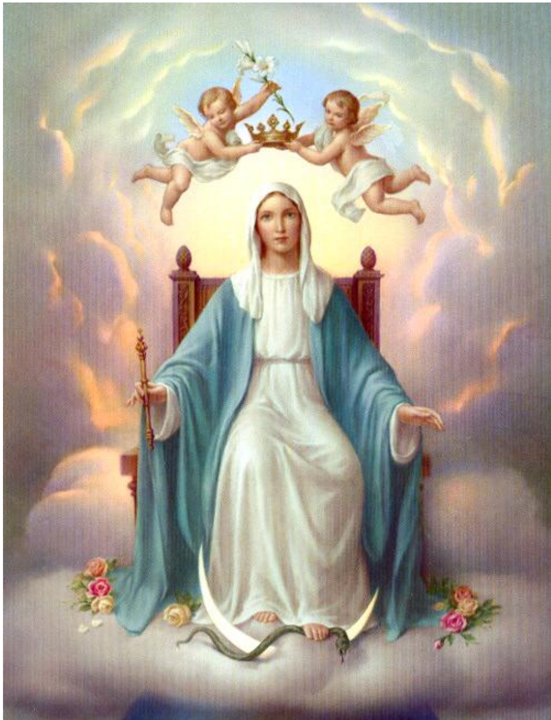
Santa María Reina